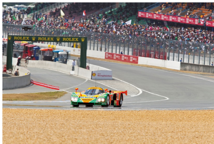
La Mazda 787B durante l'esibizione in ricordo del 20° anniversario della sua vittoria. (2011, Circuito de la Sarthe)

Roma, giovedì 25 giugno 2026. Mazda Motor Corporation porterà in pista la Mazda 787B, la leggendaria vettura vincitrice della 24 Ore di Le Mans, in occasione della Le Mans Classic 2026, uno dei più importanti eventi al mondo dedicati alle auto storiche da endurance. La manifestazione si svolgerà dal 2 al 5 luglio 2026 sul Circuit de la Sarthe di Le Mans, in Francia.