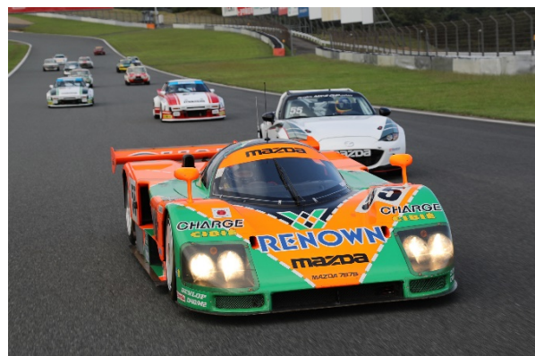
La Mazda 787B in parata insieme ad altri modelli storici (2018, Be a Driver. al FUJI SPEEDWAY)

■ Per approfondire la storia della Mazda 787B e la vittoria di Mazda alla 24 Ore di Le Mans, visita il sito commemorativo dedicato: